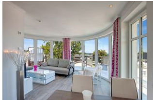
Blick in den Wohnraum

SEHR MODERN und mit SEEBLICK aus dem Wohnraum mit GROSSER FENSTERFRONT zur SEESEITE und von der GROSSEN DACHTERRASSE (ca. 55 qm mit Strandkorb und Möbeln). Mit FAHRSTUHL, nur ca. 100 m zur Strandpromenade! Luxuriös und komfortabel eingerichtete 2 - Zimmer - Wohnung mit sehr guter Ausstattung! Separates Schlafzimmer, ein zum Schlafzimmer offenes Bad mit großer walk-in-Dusche und Badewanne, ein separates WC. Der große Wohnbereich besticht durch eine gerundete Fensterfront und einen schönen Küchen- und Eßbereich, sowie einen KAMINOFEN. Die Wohnung verfügt über FUSSBODENHEIZUNG. Sie nimmt mit der großen Dachterrasse das gesamte Dachgeschoß des hinteren (seeseitigen) Hausteils ein. Zur Wohnung gehört ein STRANDKORB AM STRAND. Sie verfügt über einen Pkw-Stellplatz in der teilüberdachten Tiefgarage. Fahrradabstellfläche ist vorhanden. Vom Haus aus können Sie das Ortszentrum und die Ahlbecker Seebrücke in ca. 2 Minuten zu Fuß erreichen.