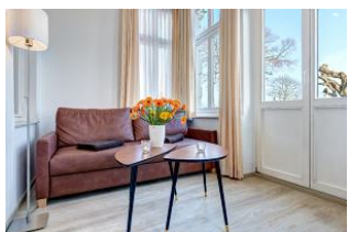
Wohnbereich in der Veranda mit direktem Gartenzugang und dortiger Terrasse