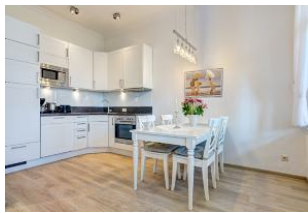
Küche mit Essplatz