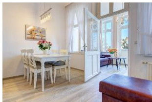
Essbereich und Lesecouch mit Blick zum Wohnbereich in der Veranda