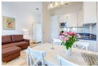
Essplatz und Küche mit Relax-/Lesecke zusätzlich zum Wohnraum. Die Couch kann zum Schlafen ausgezogen werden

Direkt an der Strandpromenade mit großem GARTEN und SÜDBALKON! Chices geräumiges 2 1/2 - Zimmer - Apartment mit guter Ausstattung. Separates Schlafzimmer, Kombiraum mit zus. Schlafcouch, Küche mit Essplatz im Kombiraum, Bad mit Wanne und Dusche, Veranda als Wohnraum mit direktem Gartenzugang und Terrasse, separater Wohnungseingang und Südbalkon mit Sonne bis abends. Die Wohnung verfügt über einen Pkw-Stellplatz. In der Garage können Fahrräder und ähnliches untergestellt werden. Im Haus gibt es eine Sauna. Von der "Villa Germania" aus können Sie das Ortszentrum und die bekannte Ahlbecker Seebrücke in ca. 3 Minuten zu Fuß erreichen. Zum Strand sind es 50 m. Von Mai bis September ist ein Strandkorb im Tagespreis enthalten.