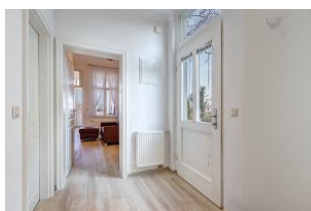
Eingangsflur mit Blick zum Wohn-/Essbereich