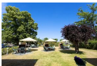
Garten mit Terrassen und Strandkörben (Mai bis September)