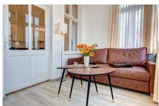
Wohnbereich in der Veranda