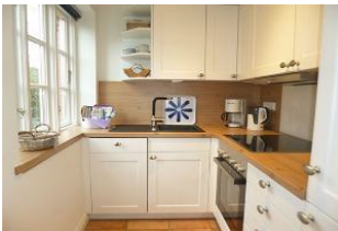
Die Ausstattung lädt zum Kochen mit regionalen Produkten ein.