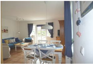
Man hat einen direkten Zugang auf die möblierte Süd-West-Terrasse mit Strandkorb (April- Anfang Okt.)