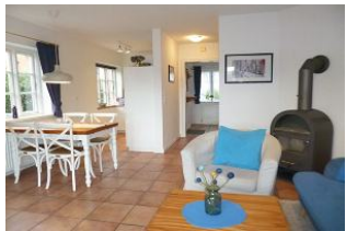
Der Essplatz und die offene, komplett ausgestattete Küche mit Geschirrspüler schließt sich dem Wohnzimmer an.