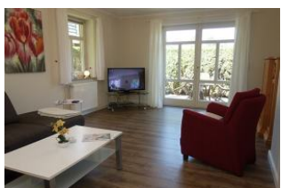
Gemütlicher Sessel, großes TV Gerät mit DVD Player ....