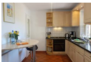
Die separate Küche ...