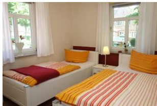
Im Erdgeschoß das Schlafzimmer mit zwei Einzelbetten und ...