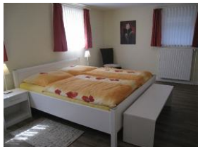
Ein großes Schlafzimmer im UG