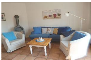
Das Erdgeschoß wurde mit Terrakottafliesen und Fußbodenvorwärmung ausgestattet. Hier befindet sich das behagliche Wohnzimmer mit Kaminofen.

Diese gemütlich eingerichtete rechte Doppelhaushälfte in Nieblum im Babendörpstieg 22 lädt 4 Personen zur Erholung ein. Unsere Gäste sollten Nichtraucher sein. Die strand- und dorfnah Lage bietet einen Urlaub mit kurzen Wegen. Im schönen Ortskern von Nieblum mit seinen historischen Reetdachhäusern finden Sie alle Einkaufsmöglichkeiten, Cafes, Restaurants, Minigolf, Frisör und E-Ladestation für Ihren PKW.