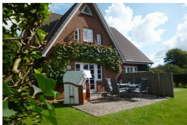
Die Gartenansicht der rechten DHH im Babendörpstieg 22 in Nieblum.

Die Unterkunft verteilt sich über EG und 1.OG.