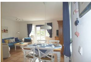
Man hat einen direkten Zugang auf die möblierte Süd-West-Terrasse mit Strandkorb (April- Anfang Okt.)