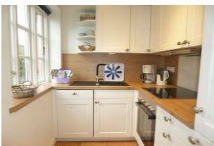
Die Ausstattung lädt zum Kochen mit regionalen Produkten ein.