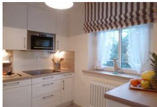
Hier macht auch das Kochen im Urlaub Spaß.