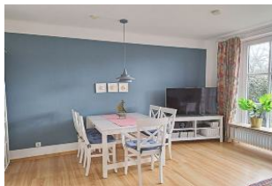
Die möblierte Terrasse mit Strandkorb (April - Okt.) erreichen Sie vom Wohnzimmer aus.