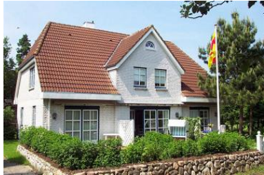
Das gemütliche Mittelhaus in Nieblum, Gartenstraße 12

Die Unterkunft verteilt sich über EG und 1.OG.