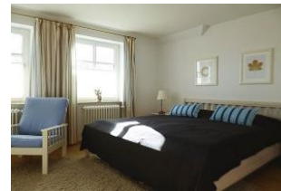
Das helle behagliche Schlafzimmer mit Doppelbett (180x200 cm), zwei Sesseln und einer kleinen Schreibablage.