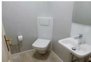
Im Erdgeschoss befindet sich ein modernes kleines Gäste-WC.