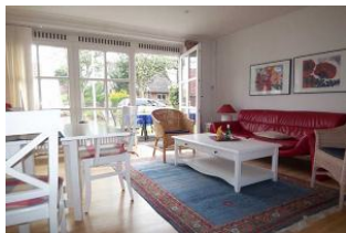
Das gemütliche Wohnzimmer mit Esstisch und Kamin ist hell gestaltet. LCD-Sat-TV mit DVD-Spieler und WLAN gehören zur Ausstattung.

Das Haus für Nichtraucher zeichnet sich durch die besonders ruhige Lage am Rand des alten Dorfkerns aus. Zum Nieblumer Strand sind es ca. nur 700 m. Das Mittelhaus bietet Platz für 4 Pers. + max. 1 Kleinstkind im Kinderreisebett und wurde kinderfreundlich eingerichtet. Im hellen Wohnraum mit Esstisch sitzt man gemütlich vor einem offenen Kamin. Ein PKW-Stellplatz befindet sich auf dem Grundstück.