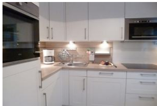
Die separate Küche mit Geschirrspüler, Nespresso Maschine, Waschmaschine und Mikrowelle ist komplett ausgestattet.