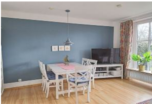
Die möblierte Terrasse mit Strandkorb (April - Okt.) erreichen Sie vom Wohnzimmer aus.