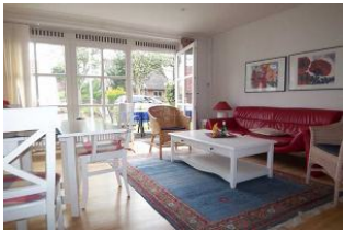
Das gemütliche Wohnzimmer mit Esstisch und Kamin ist hell gestaltet. LCD-Sat-TV mit DVD-Spieler und WLAN gehören zur Ausstattung.

Das Haus für Nichtraucher zeichnet sich durch die besonders ruhige Lage am Rand des alten Dorfkerns aus. Zum Nieblumer Strand sind es ca. nur 700 m. Das Mittelhaus bietet Platz für 4 Pers. + max. 1 Kleinstkind im Kinderreisebett und wurde kinderfreundlich eingerichtet. Im hellen Wohnraum mit Esstisch sitzt man gemütlich vor einem offenen Kamin. Ein PKW-Stellplatz befindet sich auf dem Grundstück.