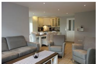
Die Sitzecke mit Blick zur Küche