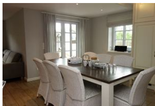
Dieser Esstisch bietet allen Familienmitgliedern einen Platz.