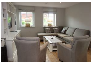
Die Sitzecke...für jeden ein gemütliches Plätzchen