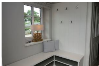
Der Eingangsbereich, Platz für Outdoorkleidung und Schuhe

Im idyllischen Ort Oevenum finden Sie das Doppelhaus Golfoase. Zwei großzügige Doppelhaushälften für je 6 Personen erwarten Sie. Ein gemütliches Wohnzimmer mit offener Küche und familientauglichem Essplatz, Austritt in den Garten und zur möblierten Terrasse, Sauna (mit Zusatzkostenverbunden). Ein großes Badezimmer mit Waschmaschine und Trockner. Im Obergeschoß die Schlafräume und ein weiteres Dusch+Wannenbad. Hier ist an alles gedacht, hier kann man sich wohlfühlen, hier... wird es Ihnen einfach nur gut gehen und das Beste.....Ihr Vierbeiner darf auch dabei sein.