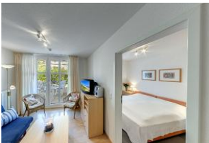
Blick in das Schlafzimmer