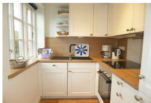
Die Ausstattung lädt zum Kochen mit regionalen Produkten ein.