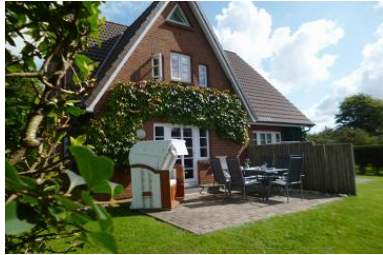
Die Gartenansicht der rechten DHH im Babendörpstieg 22 in Nieblum.

Die Unterkunft verteilt sich über EG und 1.OG.