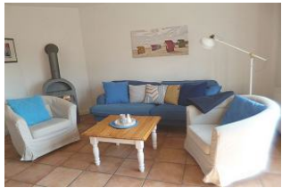
Das Erdgeschoß wurde mit Terrakottafliesen und Fußbodenvorwärmung ausgestattet. Hier befindet sich das behagliche Wohnzimmer mit Kaminofen.

Diese gemütlich eingerichtete rechte Doppelhaushälfte in Nieblum im Babendörpstieg 22 lädt 4 Personen zur Erholung ein. Unsere Gäste sollten Nichtraucher sein. Die strand- und dorfnah Lage bietet einen Urlaub mit kurzen Wegen. Im schönen Ortskern von Nieblum mit seinen historischen Reetdachhäusern finden Sie alle Einkaufsmöglichkeiten, Cafes, Restaurants, Minigolf, Frisör und E-Ladestation für Ihren PKW.