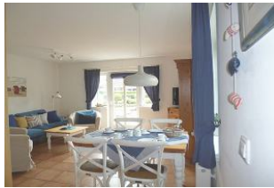
Man hat einen direkten Zugang auf die möblierte Süd-West-Terrasse mit Strandkorb (April- Anfang Okt.)