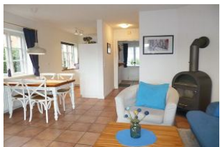
Der Essplatz und die offene, komplett ausgestattete Küche mit Geschirrspüler schließt sich dem Wohnzimmer an.