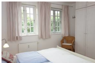
Der große Kleiderschrank hat viel Platz für die Kofferinhalte