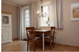
Der Esstisch aus der Nähe, ausziehbar.