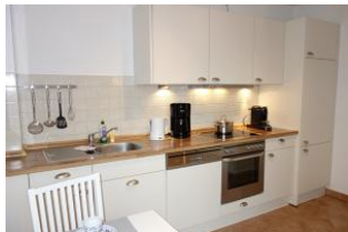
...der andere Teil der Küche.