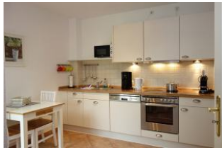
Ein zweiter Essplatz in der Küche und ein Teil der Küchenzeile.