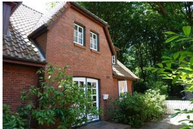
Die Aussenansicht des Hauses Eulenkamp 6c

Die Unterkunft verteilt sich über EG und 1.OG.