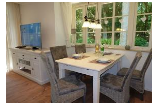
...der Tisch ist schon gedeckt !