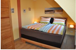
... mit Boxspringbett und Stauraum.