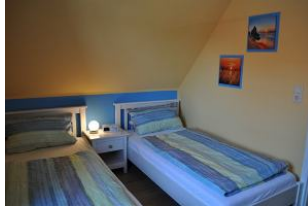
Das zweite Schlafzimmer...