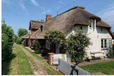
Die Unterkunft verteilt sich über EG und 1.OG.

Idyllische Ferien auf Föhr im historischen Ortskern des Kurortes Alkersum FÖHRliebt - gemütliches Ferienhaus unter Reet Unsere "2" Heimat" befindet sich in einem historischen Gebäudekomplex als "ENDhaus". Umgeben von einem romantisch großen Garten in südwestlich ausgerichteter Richtung und unendlicher Natur. Eingebettet in Geest und Marsch, den inseltypischen Landschaftsformen, die unsere Besucher zu Fuß oder per Fahrrad zur Erkundung von Flora und Fauna einladen. Das 50qm große Ferienhaus "FÖHRliebt" ist ideal für zwei Personen und befindet sich in sehr ruhiger Lage. Für den Auto-Durchfahrtsverkehr gesperrten "Stieg", im Ortskern des Kunst- und Pferdedorfes Alkersum - im Herzen der schoenen Insel Föhr. Der friesischen Karibik. Ein Bäcker, sowie der Hofladen "Föhler Inselkäse", befinden sich in unmittelbarer Nähe und sind fußläufig zu erreichen (ca. 200m). Mit dem Fahrrad zum nächstgelegenen Strand nach Goting, sind es ca. 10 Minuten, nach Utersum rund 15 und nach Wyk Stadt ebenfalls ca. nur 10 Minuten.