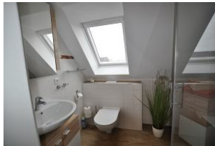
Das helle Badezimmer ...