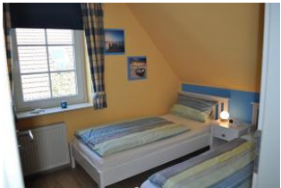
...mit zwei Einzelbetten.