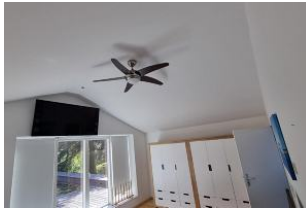
Schlafzimmer mit Dachterasse