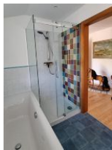
1 Bad mit Badewanne und Dusche