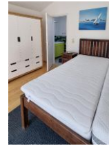
Schlafzimmer mit extra Bad