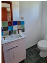
Gäste WC EG