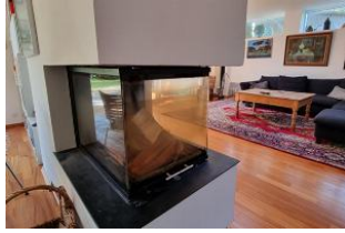
Kamin im Wohn und Essbereich