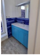
2 Bad mit Dusche