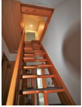
Bei der Treppe, die in das Kinderzimmer im 2. OG führt, handelt es sich um eine Raumspartreppe mit versetzten Stufen.