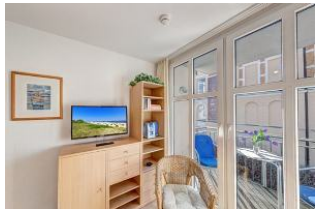
TV und Balkon

Direkt an der Strandpromenade mit SÜDBALKON und FAHRSTUHL im Haus! Schönes gemütliches 2-Zimmer-Apartment mit moderner guter Ausstattung. Separates Schlafzimmer (mit Fernseher), Wohnzimmer mit Küchenzeile und Essplatz, Duschbad, Balkon nach Süden mit Sonne bis abends. Die Wohnung verfügt über einen Tiefgaragen-Pkw-Stellplatz. In der Garage können auch Fahrräder und ähnliches untergestellt werden. In unserer "Villa Germania" nebenan gibt es eine Sauna. Von der "Villa Aquamarina" sind es zum Ortszentrum und der Seebücke ca. 3 Minuten zu Fuß. Zum Strand sind es 50 m.