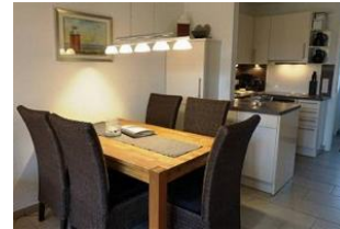
Der Essbereich für gemeinsame Stunden