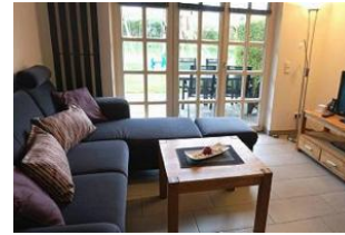
... mit direktem Ausgang auf die eigene Terrasse und in den Gemeinschaftsgarten