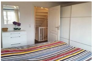
... und großem Kleiderschrank