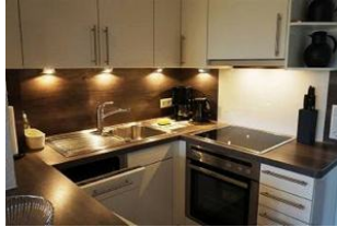
Die kleine Küche ist voll ausgestattet