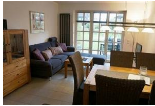
Das gemütliche Wohnzimmer ...