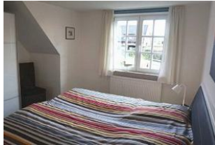
... mit gemütlichem Doppelbett ...