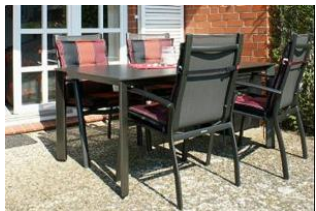
Die eigene Terrasse

Haustiere sind nach vorheriger Absprache gerne Willkommen!