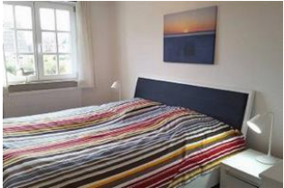
Das große Schlafzimmer im 1. OG