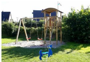
Der gemeinschaftliche Kinderspielplatz im Garten