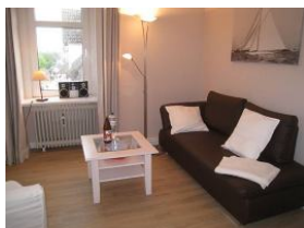
Die neue Couch zum "langmachen" und ...