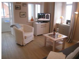
Das Flachbild - TV - Gerät + DVD Player