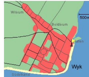
Entfernungen, zirka: zum Bäcker 25 m, zur Einkaufsmöglichkeit 25 m, zum Flugplatz 3,0 km, zum Golfplatz 3,0 km, zum Hafen 50 m, zum Meer 2 m, zum Badestrand 2 m, zum Ortszentrum 0 m