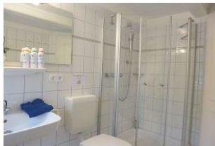
Ein zweites Duschbad mit Tageslicht steht Ihnen in der Wohnung zur Verfügung.