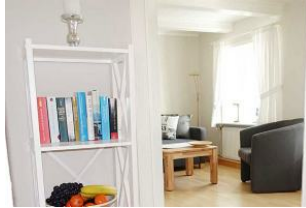
Das Ambiente der Wohnung wirkt heimelig und einladend.