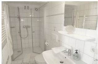
Das en suite Bad mit walk in Dusche ist hell gefliest. Dort steht ein kombiniertes Wasch/Trocknergerät zur kostenfreien Nutzung bereit.