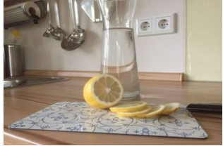
Sauer macht lustig ...