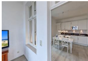
Blick in die Wohnküche