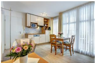
Küche, Wssen, Wohnen

1. Reihe, direkt an der Strandpromenade mit SÜDBALKON! FAHRSTUHL im Haus! Schönes 2-Zimmer-Apartment mit moderner guter Ausstattung. Separates Schlafzimmer (mit Fernseher), Wohnzimmer mit Küchenzeile mit Essplatz, Duschbad, Balkon zur Südseite mit Sonne bis abends. Die Wohnung verfügt über einen Pkw-Stellplatz. In der Garage können auch Fahrräder und ähnliches untergestellt werden. Von der "Villa Aquamarina" aus können Sie das Ortszentrum und die bekannte Ahlbecker Seebrücke in ca. 3 Minuten zu Fuß erreichen. Zum Strand sind es 50 m.