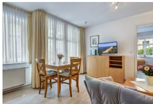
Wohnen, Essen, Blick zum Schlafzimmer