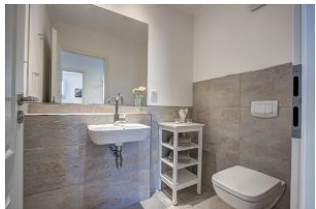
separates Gäste WC