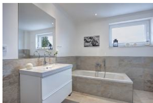
Badezimmer mit Dusche und Wanne