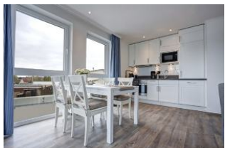
Essplatz und Küche