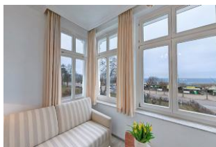
Blick aus Veranda