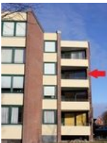
Im 2. OG befindet sich Ihre Wohnung, die mit dem Fahrstuhl ohne Anstrengung zu erreichen ist.