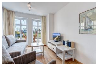
Wohnbereich mit Blick zur Terrasse