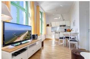
Wohnbereich mit Blick zu Küchenzeile und Essplatz