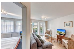
Türe zum Schlafzimmer