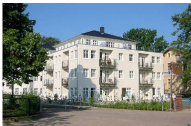
Hausansicht "Villa Aquamarina" von der Promenade