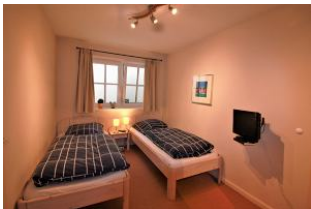
Das dritte Schlafzimmer befindet sich im UG und ist mit zwei Einzelbetten ausgestattet.