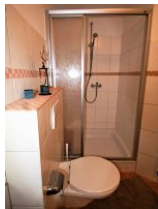
Das helle Duschbad...