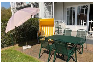
Der Garten ist eingezäunt.