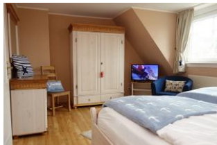
....zur Entspannung noch ein wenig fernsehen ?