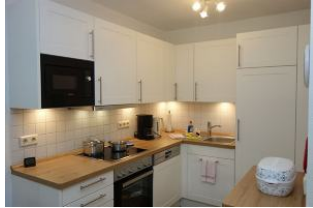
...mit viel Platz für Küchenutensilien