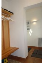
Treten Sie ein, Sie sind angekommen.