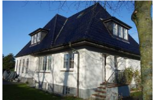
...man muss einmal um das Haus gehen um zum Eingang - ein paar Stufen hoch - zu kommen. Links "Ihre" Terrasse im Winterschlaf.

Die Wohnung 1 im Erdgeschoss des Hauses Schwalbenweg 10 in Wyk! Herrlich, großzügige Wohnung im Erdgeschoss für 2 Personen. Das Wohnzimmer mit gemütlicher Couch und Lesesessel, im Wintergarten ein großer Essplatz, sep. vollständig eingerichtete Küche, das Schlafzimmer mit großem Doppelbett 180x200 ohne Fussteil und ein Duschbad. Ruhe pur im Schwalbenweg, der Südstrand fußläufig zu erreichen, der Bäcker "um die Ecke".....so muss Urlaub sein.