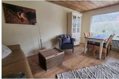
Wohnbereich mit Schlafcouch