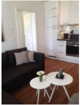
Wohnraum mit offener Küche