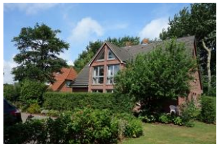
Haus Neshörn in Wyk im Sommer Die Unterkunft befindet sich im 1.OG

Das Haus Neshörn ist zu erreichen über die Straße "Am Leuchtturm" Hausno. 4 liegt gemeinschaftlich mit der "Strandvilla" auf einem großen Grundstück der Familien Buchner/Petersen. Die Whg. 3 (Rüm Hart) befindet sich im 1. und 2. OG des Hauses und hat ausreichend Platz für 4 Personen. Großer Wohn/Essraum mit offener Küche im 1.OG sowie ein Doppelschlafzimmer und das Duschbad. Im 2.OG befindet sich das zweite Schlafzimmer mit großem Doppelbett und einem weiteren Bad mit WC und Handwaschbecken. Der Clou: ein herrlichen Balkon, der Ihnen die Nachmittags- und Abendsonne beschert.