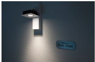
Die Wohnung 3 - Rüm Hart lädt ein .....