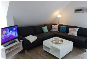
Eine große Sitzecke....