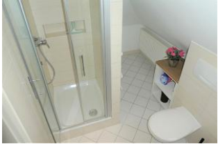
Das Duschbad im 1. OG.