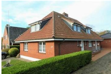
Das Haus von außen.

Die Unterkunft verteilt sich über EG und 1.OG.