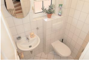
Das Gäste-WC im EG.