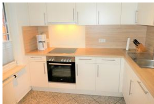
Die Küche ist komplett ausgestattet.