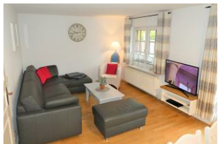
Das gemütliche Wohnzimmer.