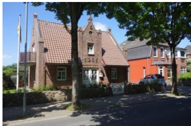
Das Haus Badestrasse 30a in Wyk

Die Unterkunft verteilt sich über EG und UG.