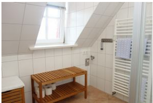
Fenster im Bad, Sitzbank