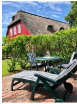
Im großen Garten ein kleines Plätzchen nur für die Wohnung 5 mit Liege und...