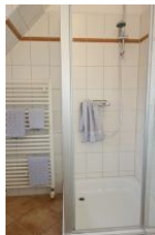
Die Duschkabine und Handtuchheizung