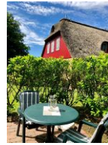
...Tisch und Stühlen.