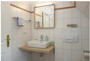
Der Waschtisch im Bad

Entfernungen, zirka: zum Bäcker 150 m, zur Einkaufsmöglichkeit 4,0 km, zum Flugplatz 4,0 km, zum Golfplatz 4,2 km, zum Hafen 4,5 km, zum ÖPNV 200 m, zum Badstrand 4,0 km, zum Ortszentrum 200 m