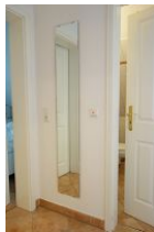
Im Flur ein großer Spiegel