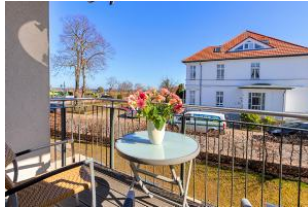
Balkon mit Ausblick