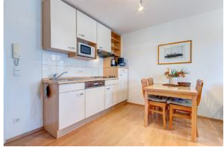
Essbereich und Küchenzeile