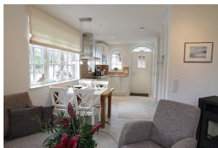
Blick in die Küche