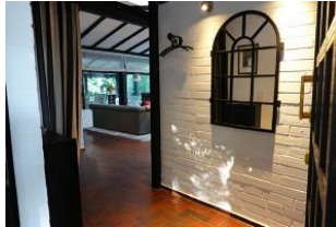
...treten Sie ein und lassen sich verzaubern