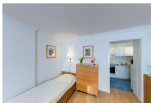
Schlafmöglichkeit für 3. Person