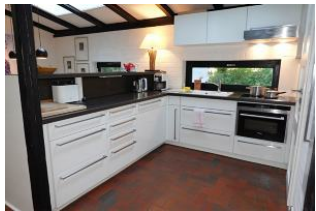
...zum Essplatz offen, sehr kommunikativ....