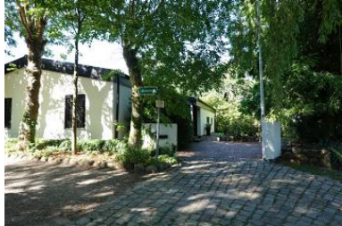
Das Haus Reidschott 9 in Boldixum