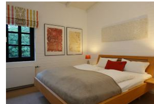
Ein Schlafzimmer mit Doppelbett 180x200cm ohne Fußteil und ...