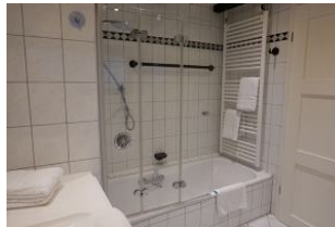
...Badewanne mit Duschköglichkeit.