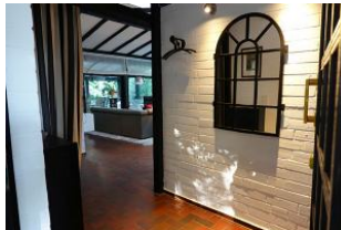
...treten Sie ein und lassen sich verzaubern