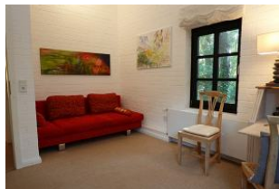
...und Schlafcouch, falls noch Besuch kommt.