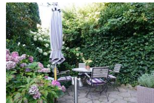
Der bestuhlte Terrassenplatz.