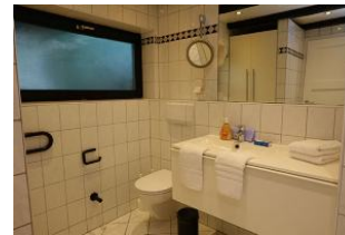
Das zweite Bad mit Handwaschbecken, Toilette und...