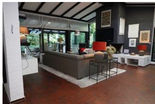
...die große Couchecke