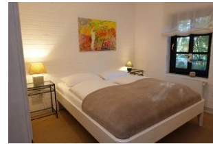
Das zweite Schlafzimmer mit Doppelbett 160x200cm ohne Fußteil und...