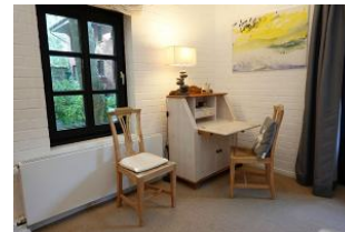
Das Arbeitszimmer für die ganz Fleissigen...