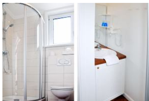
... und noch einen Blick ins Badezimmer.