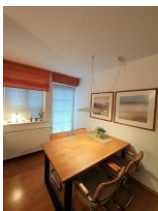
... mit Ausgang auf den Balkon.