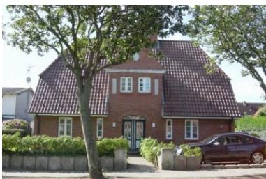
Die Unterkunft befindet sich im 1.OG.

Das Haus von außen. Die wohnung befindet sich im 1. OG rechts.