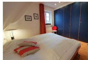
... mit viel Stauraum für Ihr Urlaubsgepäck.