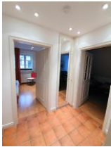
Der Eingangsbereich der Wohnung.