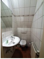
Das WC ist getrennt vom Rest des Badezimmers.