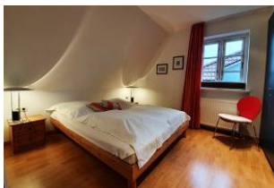
Das Schlafzimmer ...