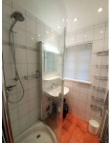
Das Tageslichtbad mit Dusche.