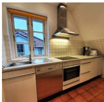
Die Küche ist sehr gut ausgestattet ...