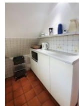
... und bietet viel Platz.