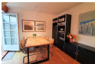
Der gemütliche Essbereich...