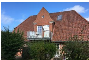
Der kleine Balkon mit eigenem Strandkorb.

Diese Ferienwohnung liegt ruhig und dennoch zentral im Herzen von Wyk. Die Unterkunft befindet sich im ersten Stock und verfügt über ein lichtdurchflutetes Wohnzimmer mit direktem Ausgang auf den Balkon, ausgestattet mit einem Strandkorb und Balkonmöbeln. Das Wohnzimmer bietet Platz für einen gemütlichen Essplatz und einer Sofaecke. Die voll ausgestattete Küche, lässt keine Wünsche offen. Das Schlafzimmer ist mit einem Doppelbett und einem großzügigem Schrank ausgestattet. Das WC liegt separat neben dem hellen Duschbad. Hier werden sie sich mit Sicherheit wohlfühlen und gut erholen.