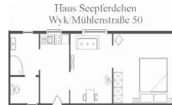
Zeichnung nicht maßstabsgetreu Änderungen unter Vorbehalt.