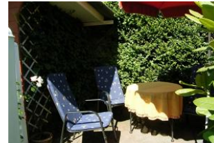
Der gemütliche Sitzplatz im Garten