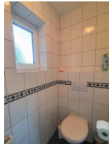
Das WC ist separat.